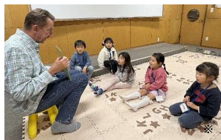
写真は昨年度のレッスンの様子